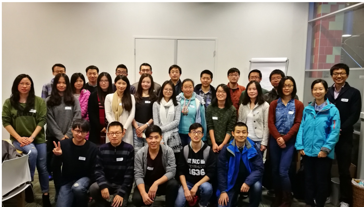
科大荷兰 2016 年校友聚会