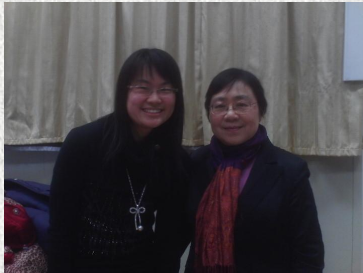
和郭镇之老师的合影